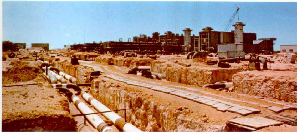
TUNISIA - Centrale gas