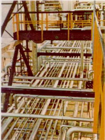
ALGERIA - Skikda - raffineria