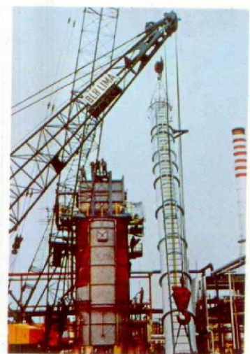
ITALIA - Raffineria di Marghera