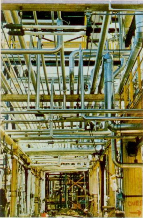
ITALIA - Manfredonia - Imp. caprolattame