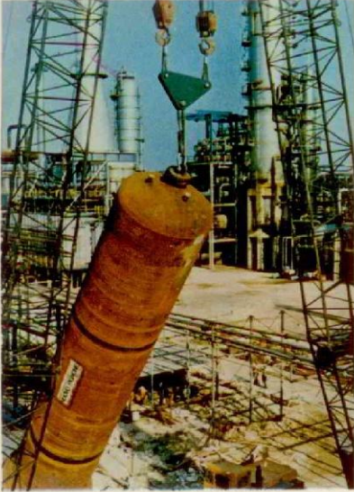
ITALIA - Bari - Imp. desolfurazione gasolio