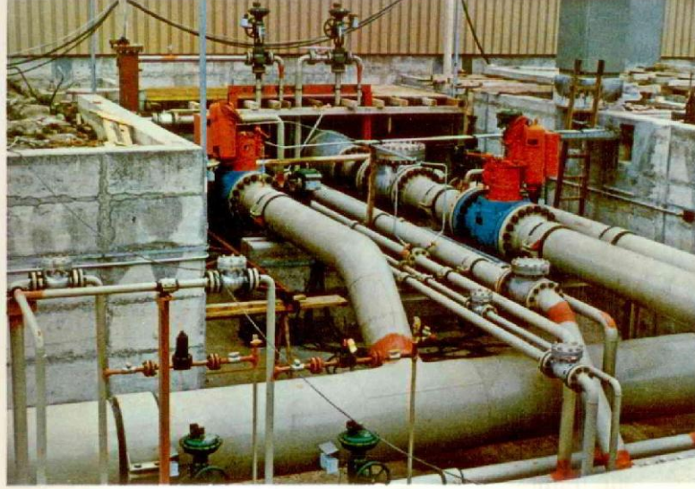
SVIZZERA - Ruswill - Centrale compress. gas.