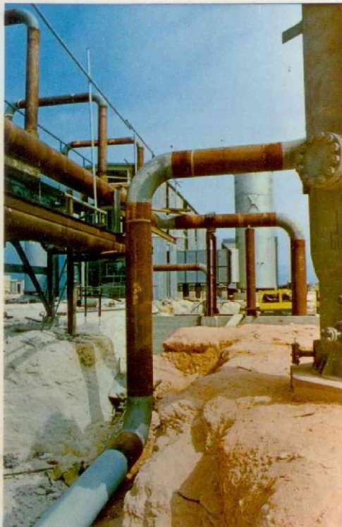
TUNISIA - Centrale gas