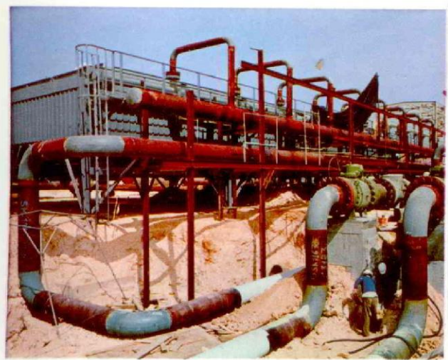
TUNISIA - Centrale gas