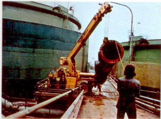
▼ ITALIA - Pegli - Linee di caricamento