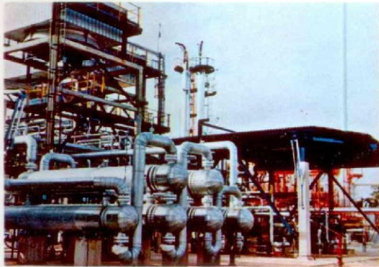
▲ ITALIA - Bari - Imp. desolforaz. gasolio