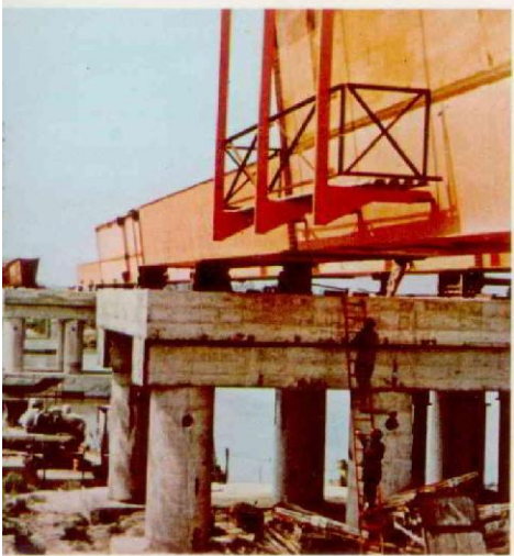
A. Pedigoro - Ponte